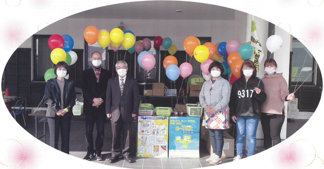
相馬支部:そうま市民まつり