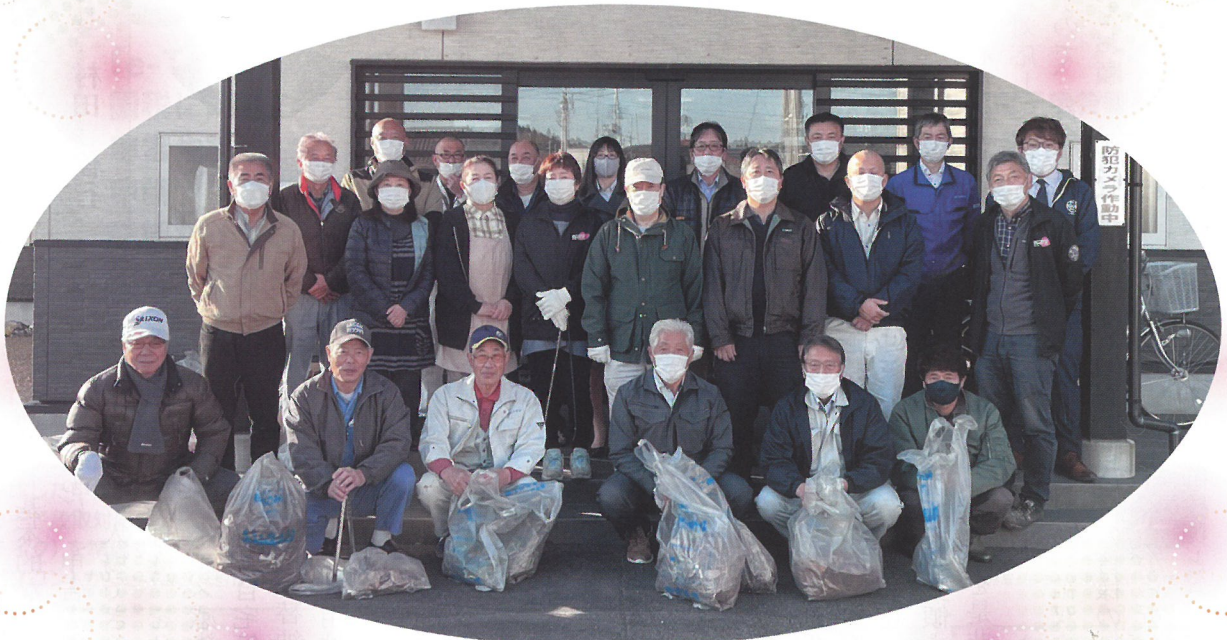
小高支部:地域清掃活動