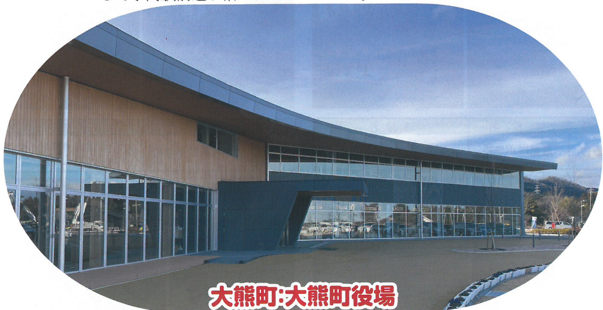
大熊町:大熊町役場

小高区の復興拠点施設、地域コミュニティの再構築の場として小高駅前通り沿いにオープンした。