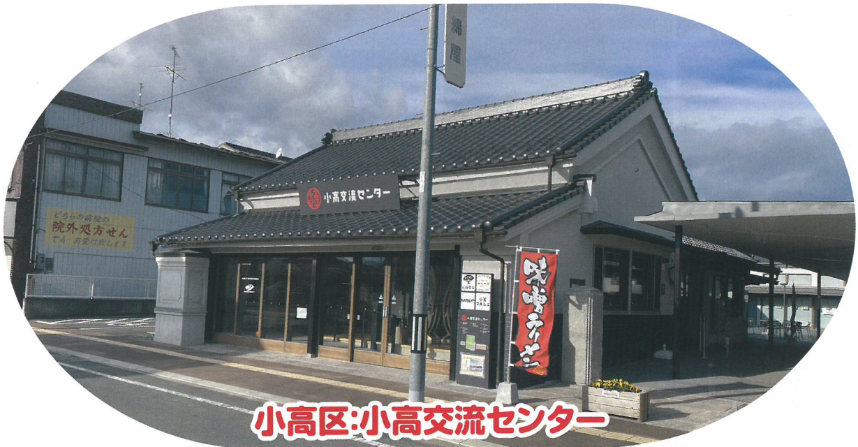
小高区:小高交流センター

小高区の復興拠点施設、地域コミュニティの再構築の場として小高駅前通り沿いにオープンした。