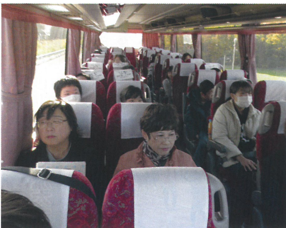
バス の車内にて 昼食会場にて