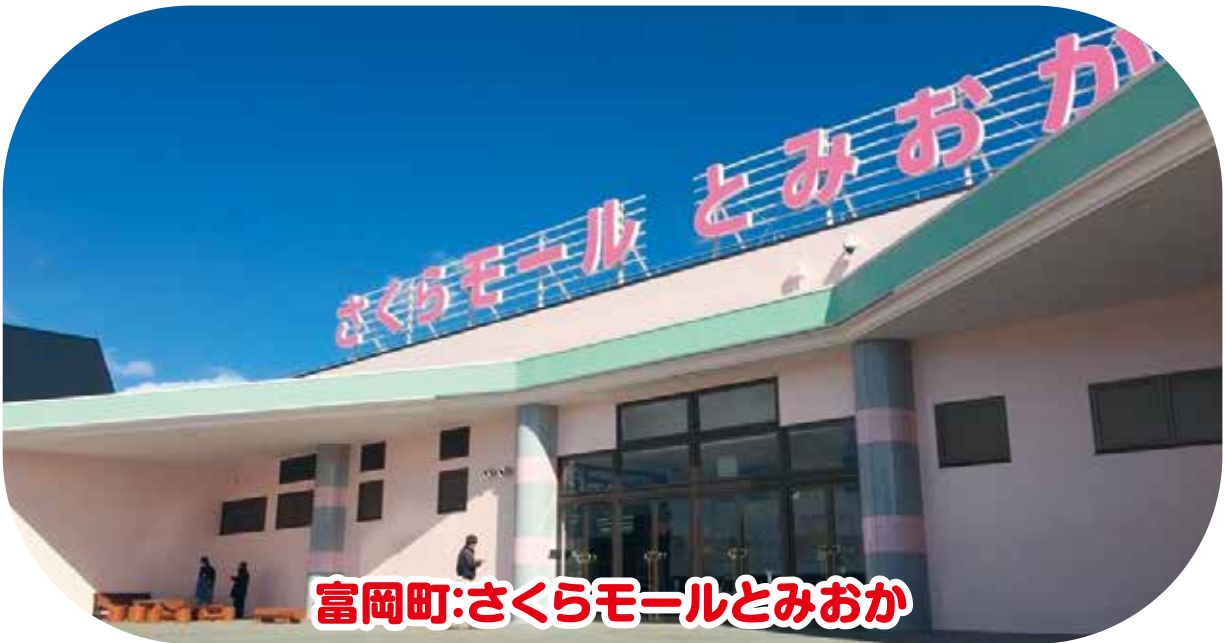
富岡町:さくらモールとみおか