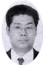
相馬税務署署長 高橋 秋男

平成 12 年の年頭に当たり、相双法人会の皆様方に謹んで新年のお祝いを申し上げます。