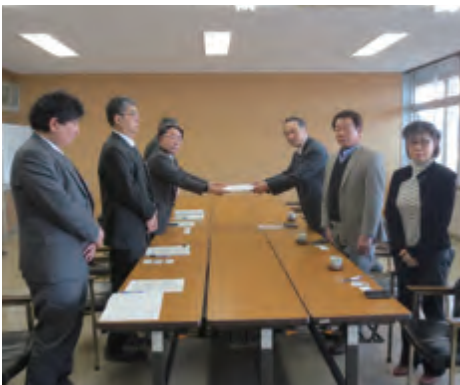
陳情者 只野会長・志賀副会長 番場常任理事