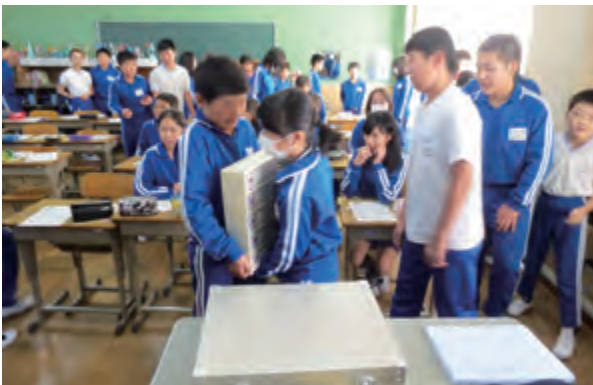
南相馬市立石神第二小学校6年生 35名 講師：伏見青年部会長

元気にクイズに答えてくれる学校。なかなか手を挙げない学校。様々でしたが、最後の感想は、「税金が私たちの生活を助けてくれていることが良くわかった。税金のある社会に暮らせて幸せと思った。」「一億円は重かった。」でした。